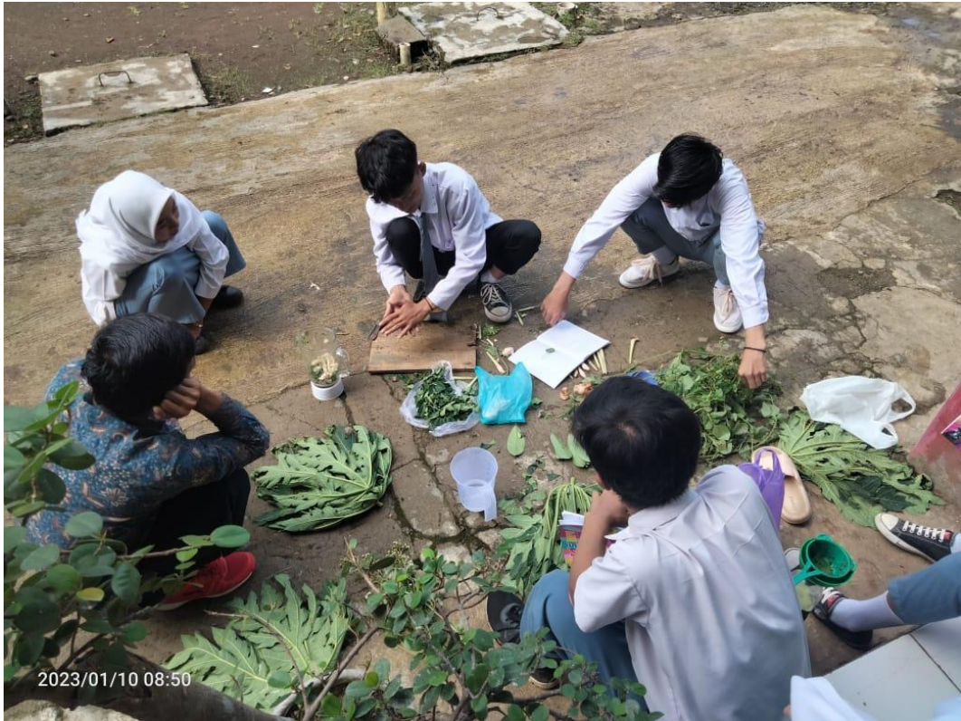
Praktik tahap pertama pembuatan pupuk