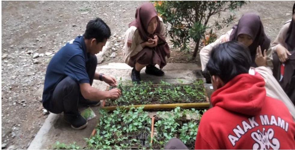
Praktek pengelolaan bibit dan perawatan tanaman