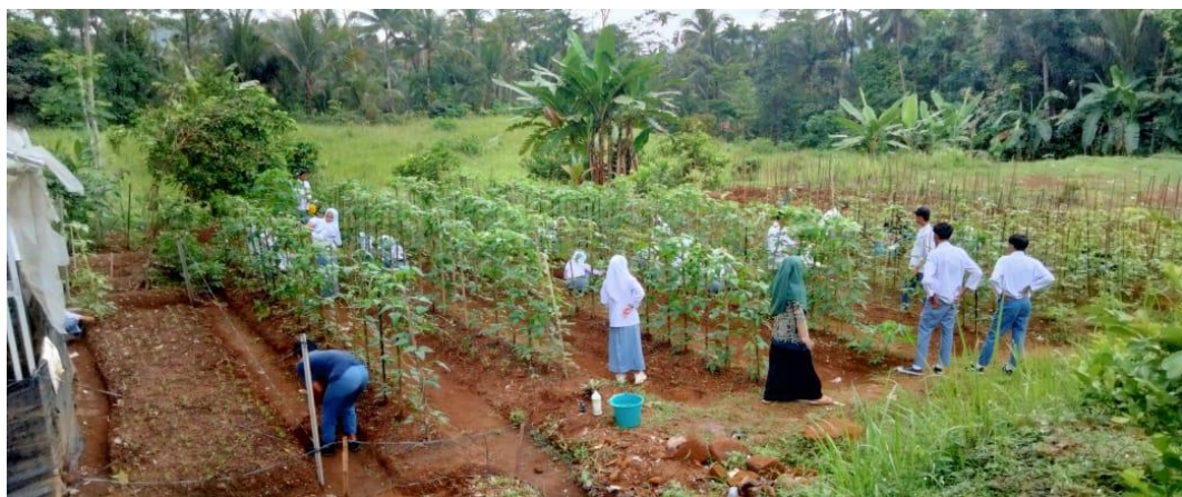
Pengolahan lahan yang mau ditanam dan perawatan tanaman kacang panjang yang sebentar lagi siap panen