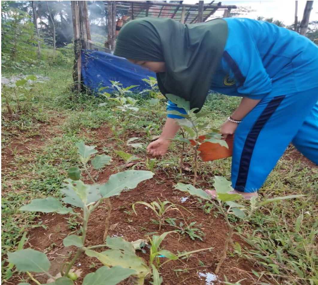
Pemupukan tanaman terong