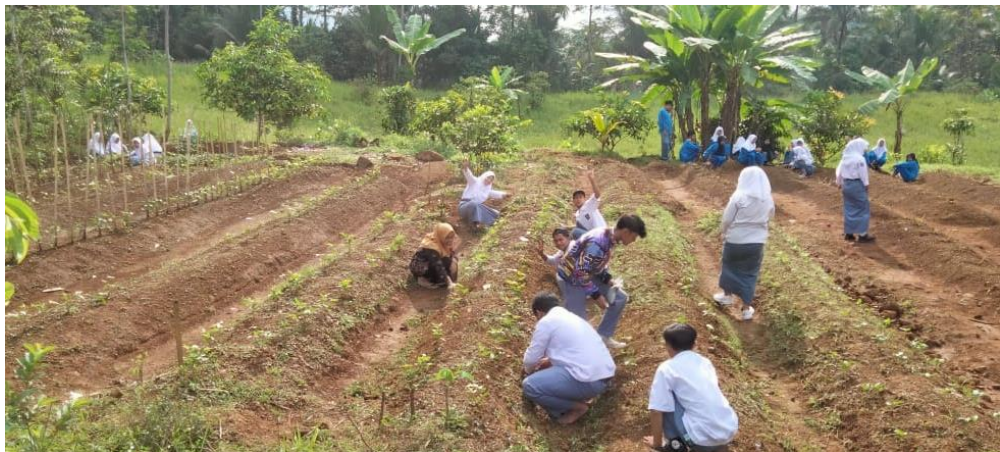
Pengelolaan lahan dan perawatan tanaman yang sudah tertanam di ladang