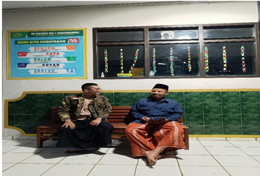
Wawancara bersama Ustadz Pondok Pesantren Mambaul 'Ulum Purbalingga