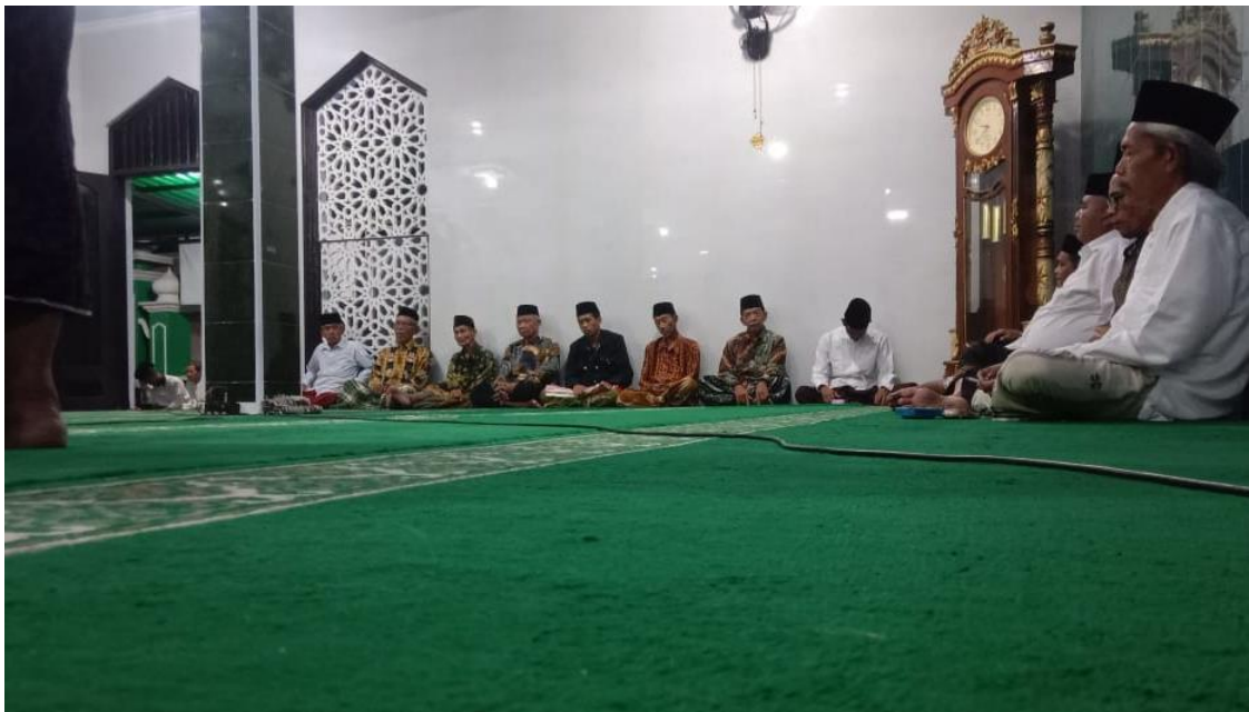
Gambar 9 Tradisi Pengajian Rutin