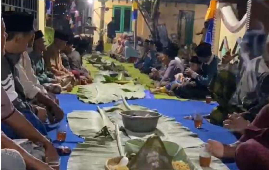
Gambar 12 Tradisi Kenduri atau slametan