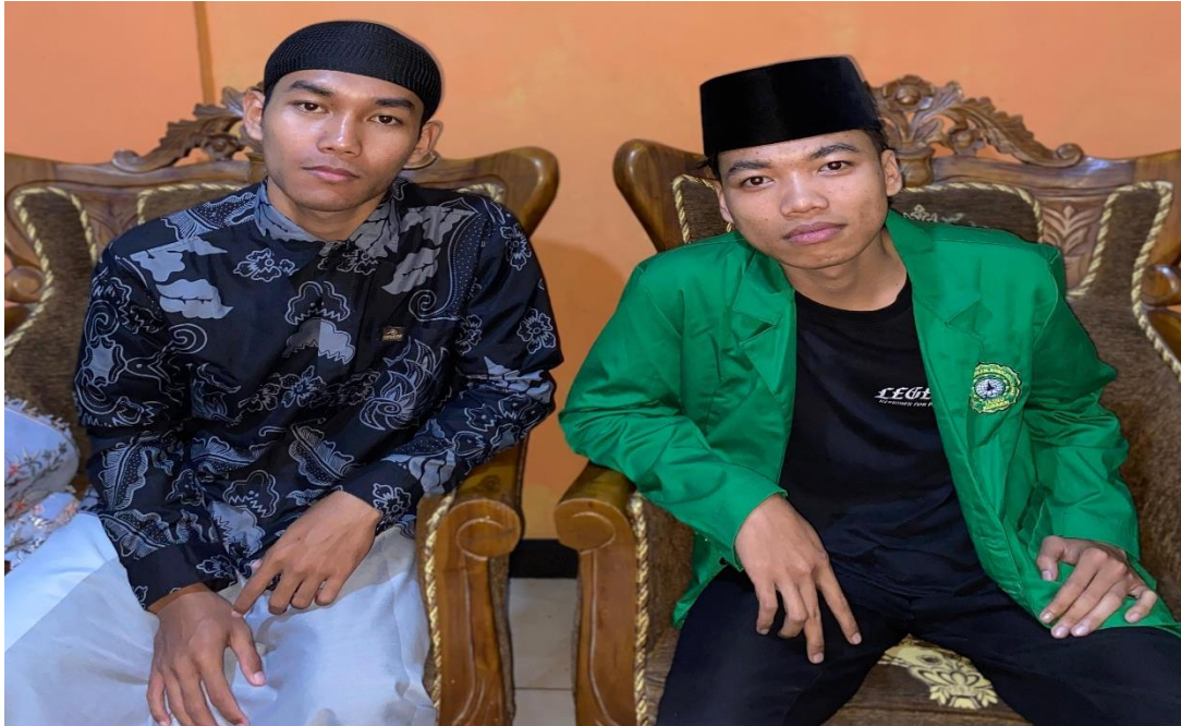
Gambar 5 Narasumber 3