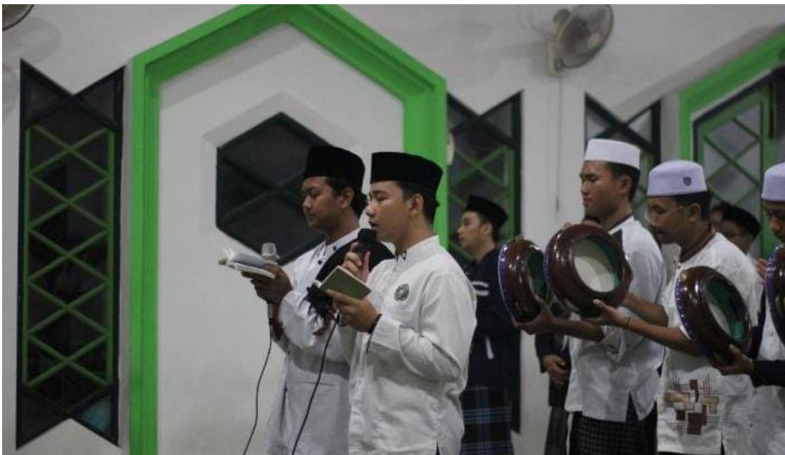
Gambar 11 Tradisi Peringatan Hari Besar Islam (PHBI)