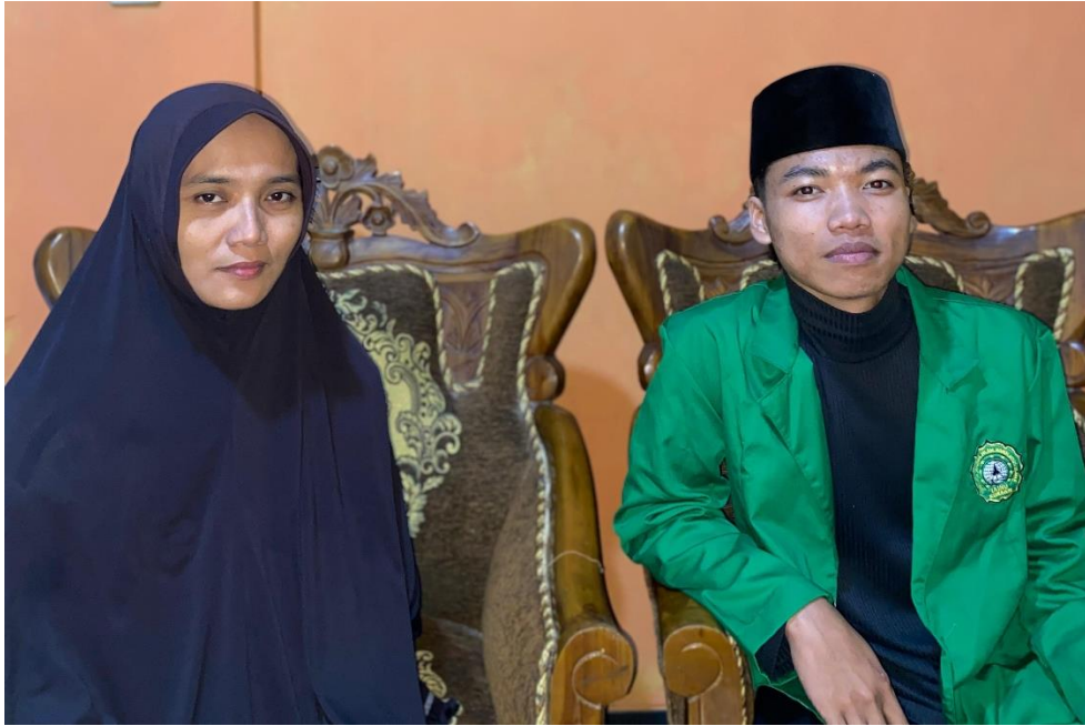
Gambar 7 Narasumber 5