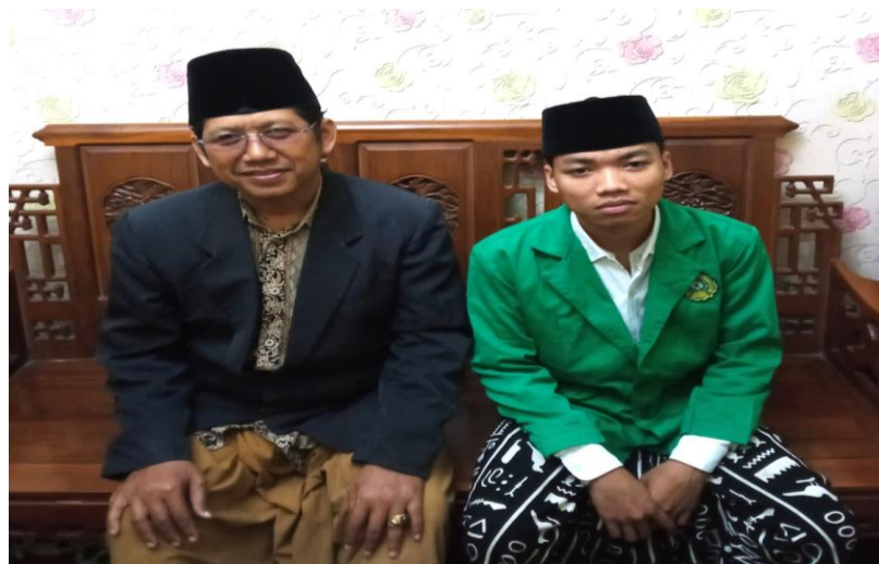
Gambar 4 Narasumber 2