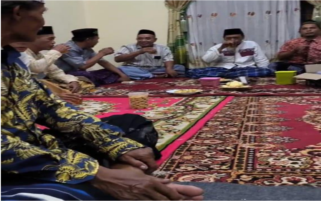
Gambar 10 Tradisi Tahlilan dan Yasinan