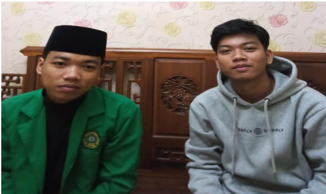
Gambar 6 Narasumber 4