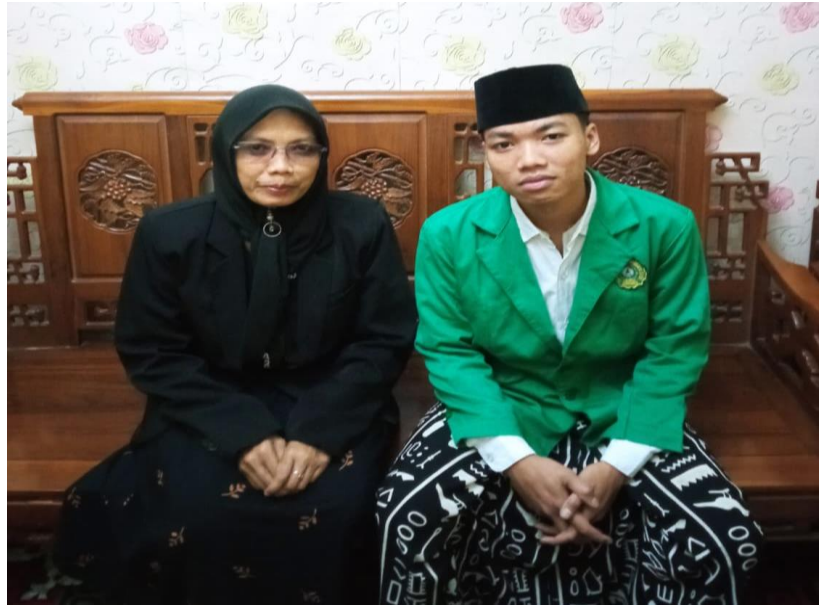
Gambar 3 Narasumber 1