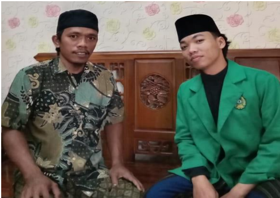
Gambar 8 Narasumber 6