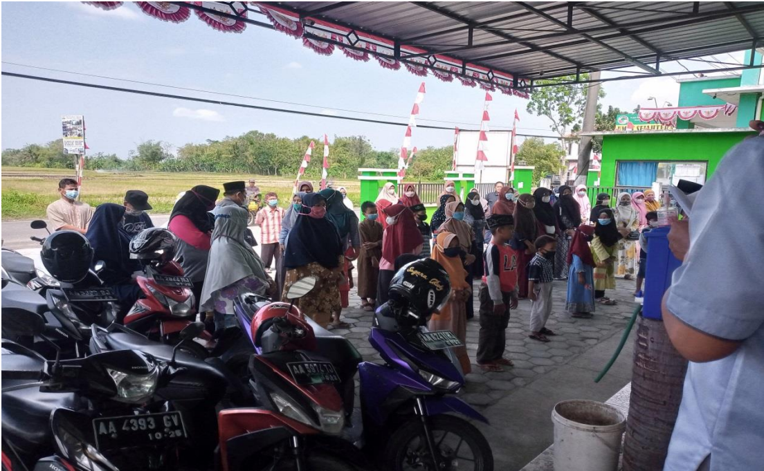
Pemberian Manfaat berupa penukaran kupon pada BMT Mart