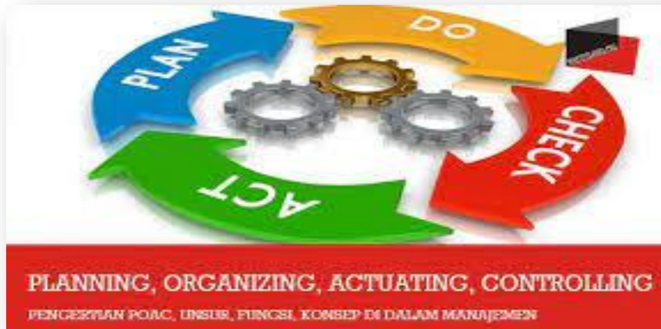
Gambar. Lingkaran POAC

Serta mengawasi sumberdaya yang ada dalam organisasi agar terpakai secara efektif dan efisien tanpa ada yang melenceng dari yang sudah direncanakan. yakni proses memonitor aktifitas-aktifitas untuk mengetahui apakah individu-individu dan organisasi itu sendiri memperoleh dan memanfaatkan sumber- sumber pendidikan secara efektif dan efisien dalam rangka mencapai tujuannya, dan memberikan kolerasi apabila tidak tercapai. 13