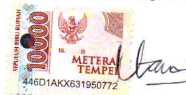
Baiti Utami Zuhriyah