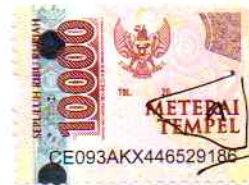
Rizqi Dwi Lestari