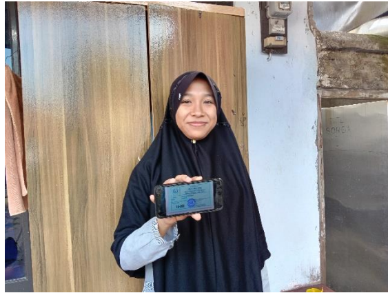
Presensi UAS Semester Genap