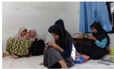
Kegiatan Pembelajaran Daring