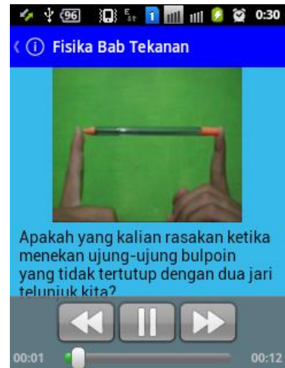
Gambar 1.1. Tampilan menu “pengantar”

Menu “Eksperimen kecil” dibuat dalam bentuk video bertujuan untuk merangsang siswa dalam berpikir kreatif dan teliti dalam melakukan percobaan sehingga mampu memahami konsep yang telah dipelajari atau memperjelas konsep. Menu ini terdiri dari tiga percobaan yang terdiri dari percobaan tekanan hidrostatis, percobaan tekanan udara, dan percobaan hukum Archimedes. Dengan adanya tampilan menu yang menarik dan nyata, siswa akan lebih memiliki perhatian yang besar dalam mempelajari materi.