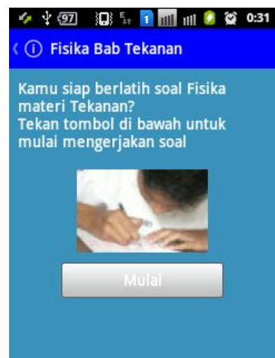
Gambar 1.3. Tampilan menu “Uji Kompetensi”