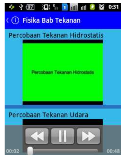
Gambar 1.2. Tampilan menu “Eksperimen kecil”