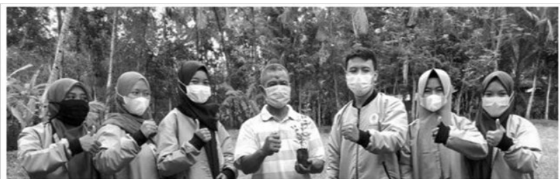
Mahasiswa dan tokoh masyarakat Sempor menyatu dalam upaya pelestarian lingkungan dan ajaran Aswaja (2021)

Tanaman bidara ( Ziziphus mauritiana Lamk. ) banyak direferensikan dalam dunia pengobatan. Tanaman bidara sebagaimana diriwayatkan dalam Hadits dapat dimanfaatkan untuk mandi junub bagi perempuan, pengobatan ruqyah, dan bagian dari prosesi memandikan jenazah. Sementara pada pengetahuan populer, tanaman bidara bermanfaat menyembuhkan luka dengan cepat, meningkatkan nafsu makan, mencegah bakteri dan virus, anti-diabetes, anti-kanker, dan lainnya. Pengetahuan populer ini tentu membutuhkan pengkajian secara lebih lanjut.